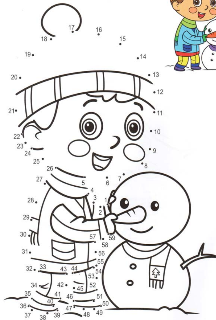
Dokreslí obrázek spojením bodů s čísly 1 - 59 a pak obrázek vybarví.