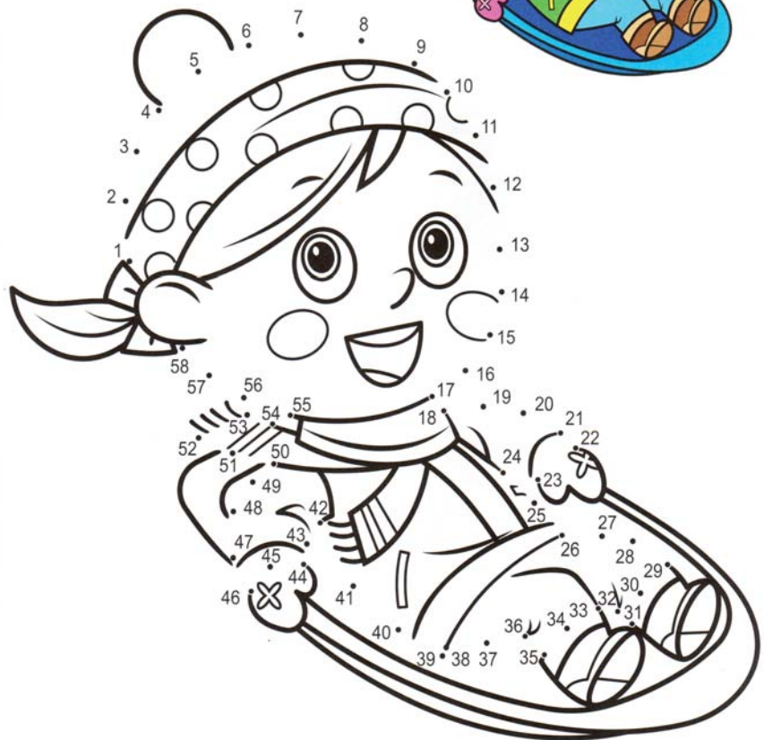
Dokreslí obrázek spojením bodů s čísly 1 - 58 a pak obrázek vybarví.